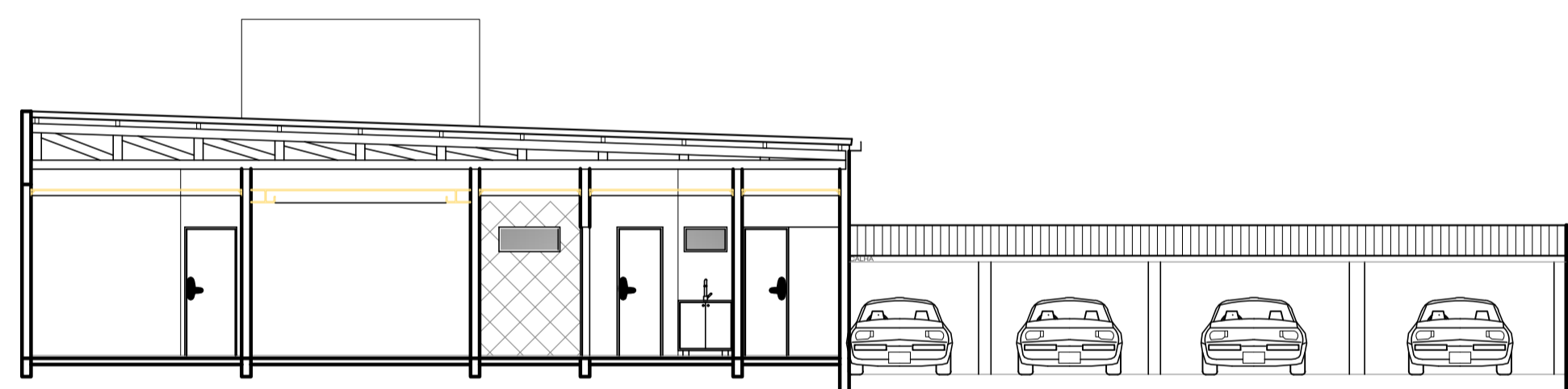
04 Corte BB' Escala: 1/100